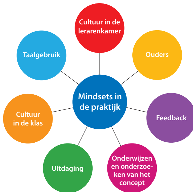
Figuur 5 Belangrijkste factoren voor een succesvolle implementatie van het concept van de growth mindset op school.

Figuur 5 geeft de belangrijkste aspecten weer die nodig zijn om een growth-mindsetcultuur op school in te voeren. Je kunt een begin maken door de mindsets te behandelen in lessen en activiteiten. Dit heeft impact op de cultuur in de klas, de gebruikte taal en het klimaat op school in het algemeen. Naarmate dit zich verder ontwikkelt, kan het nuttig zijn om een bepaald aspect te kiezen waarop je school zich in het bijzonder wil richten. Bekijk dan hoe dit aspect versterkt kan worden.