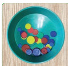
Materiaal om met stokjes te pakken bij de Uitdagingsbergen.